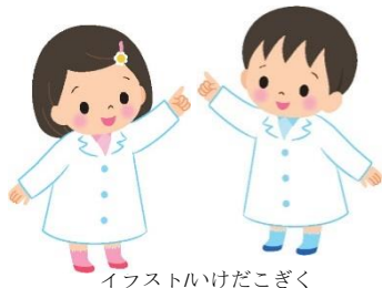
イラスト: いけだこぎく