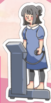
インボディ測定 *測定は素足で行います

筋肉と体脂肪のバランスや、 部位別（腕・体幹・脚）の筋 肉量を測定します。 なお、ペースメーカーを装着 されている方・妊娠している 方は測定いただけません。