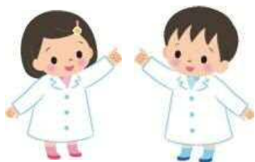
行きたいだけこぎく

応募方法：電話又はFAX（9月26日から受付） 必要事項：氏名・住所・電話番号・年齢・身長 連絡先：川崎市薬剤師会 こども調剤体験係 【電話】044-211-2325 【FAX】044-233-5456