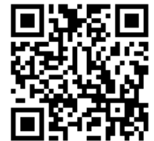
ストリートビュー